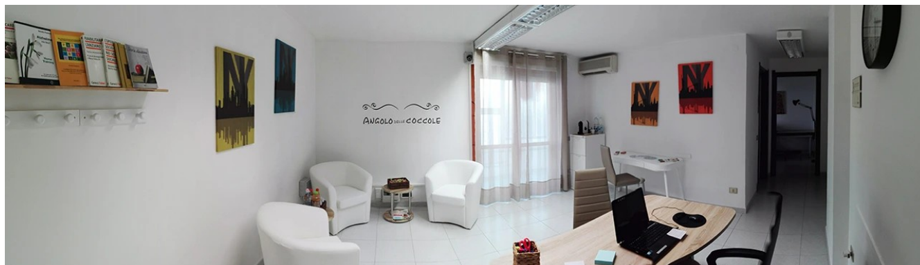
Pillole di quotidianità

Lo Studio Medico Polispecialistico opera con la filosofia "Like Home" ponendo al primo posto l'accoglienza sensibile e familiare, affinché l'utente si senta fin da subito a proprio agio, proprio come a casa, pur garantendo grande professionalità e attento ascolto.